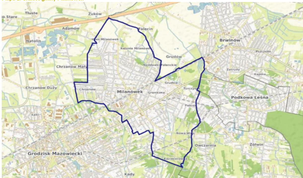
Mapa 1. Granice gminy Milanówek

Milanówek jest gminą miejską znajdującą się w powiecie grodziskim w centralno-wschodniej części województwa mazowieckiego. Sąsiaduje z gminą Grodzisk Mazowiecki i Podkowa Leśna z powiatu grodzkiego oraz z gminą Brwinów z powiatu pruszkowskiego. Zgodnie z danymi Głównego Urzędu Geodezji i Kartografii gmina Milanówek obejmuje powierzchnię 13,44 km 2 . Przebieg granic gminy Milanówek przedstawia poniższa Mapa 1 .